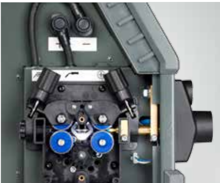
Kerékkészlet a védőkeret alá szereléshez (cikkszám: 78861413)